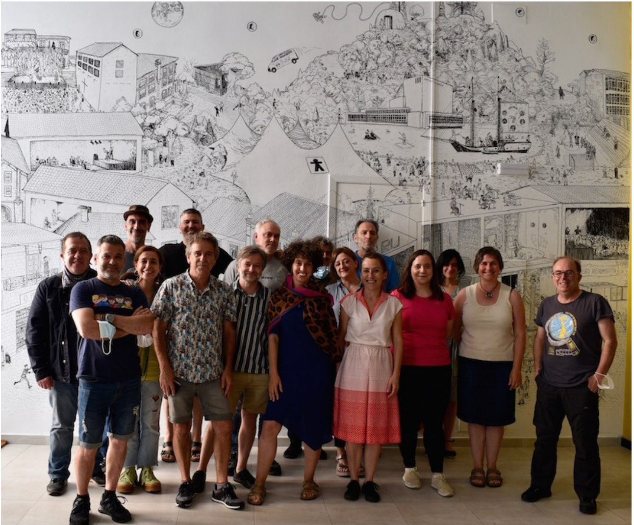
N.E.V.E.R.M.O.R.E. Equipo completo