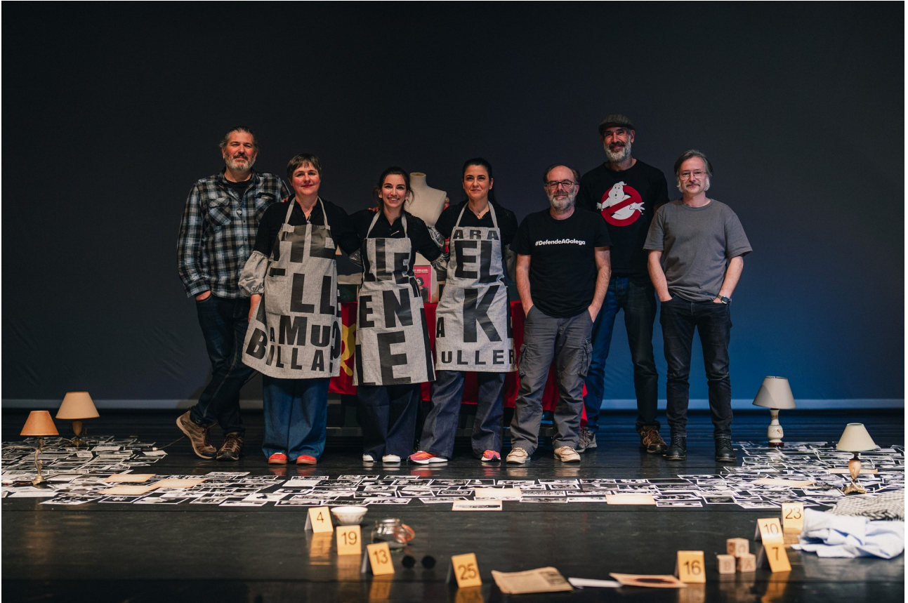
HELEN KELLER, A MULLER MARABILLA? Parte do equipo