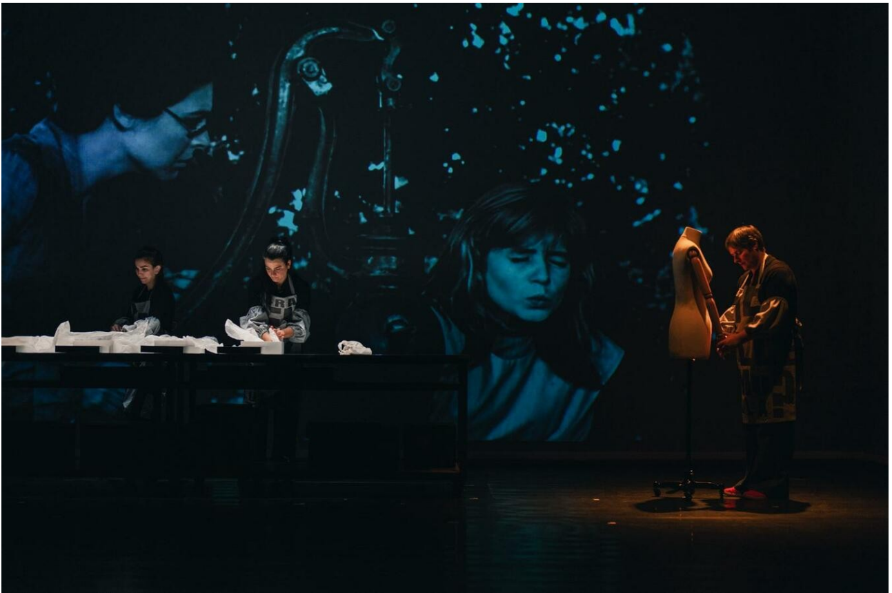
HELEN KELLER, A MULLER MARABILLA?