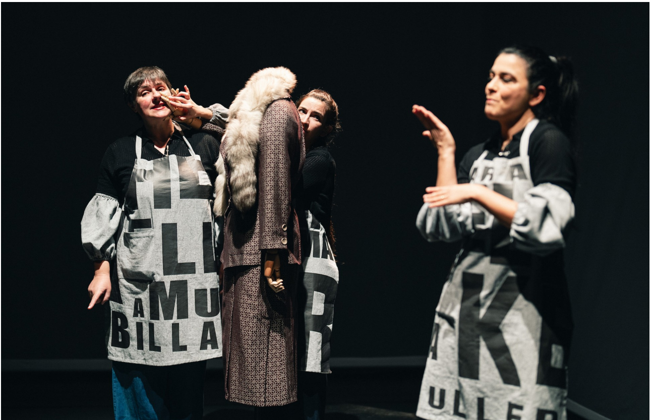
HELEN KELLER, A MULLER MARABILLA?