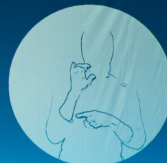
HELEN KELLER, A MULLER MARABILLA?

Helen Keller, a muller marabilla? consta de: 1 pano de fondo branco 2 mesas un busto de muller, 4 brazos articulados, 1 cabeza, 18 caixas de distintos tamaños 3 vestidos, 3 mandís, 6 lámpadas 1 bandeira 3 clips de vídeo 300 reproducións de cartas, documentos e obxectos de Helen Keller 3 actrices: Ángela, Chusa e Patricia.