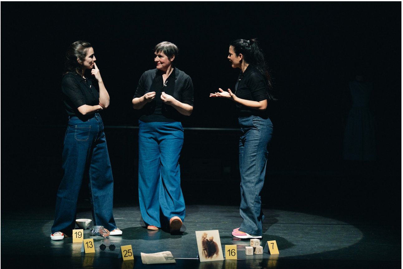
HELEN KELLER, A MULLER MARABILLA?