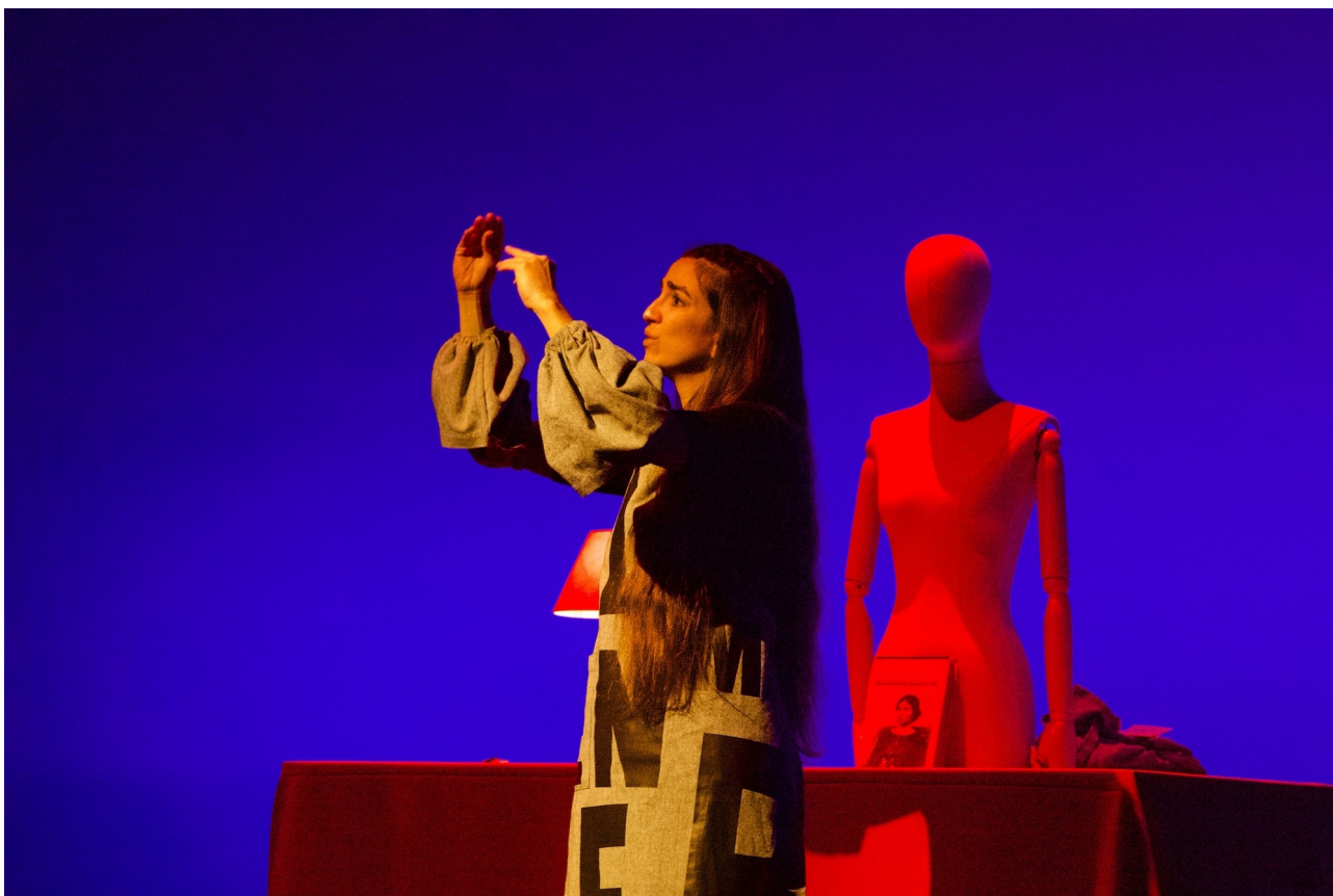
HELEN KELLER, A MULLER MARABILLA?