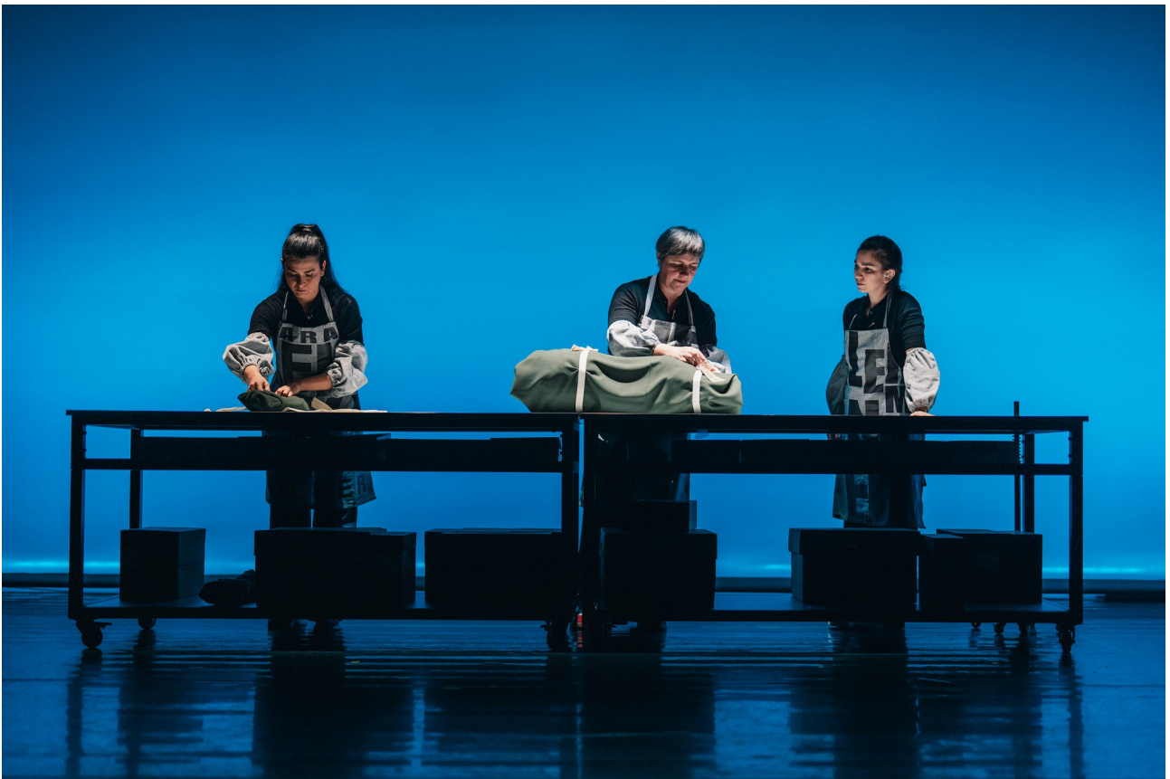
HELEN KELLER, A MULLER MARABILLA?

Despois dunha serie de obras que cuestionaron as narrativas oficiais a través de historias locais nas que se cruzan a memoria colectiva e a experiencia persoal (Citizen, Eurozone, Fillas Bravas, Eroski Paraíso, Curva España, N.E.V.E.R.M.O.R.E.), este novo proxecto vai cuestionar o noso modus operandi, co fin de seguir derbordando os límites e as estratexias das prácticas de teatro documento. Afástase das historias máis u menos locais e da mirada xeracional, pero mantén o interese por narrar desde as zonas de rozamento entre a memoria colectiva e os relatos oficiais, usando a mesma metodoloxía de traballo e as tácticas de creación propias de Chévere.