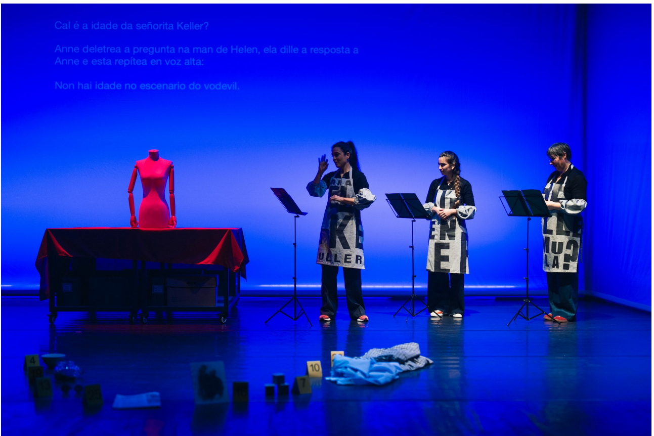
HELEN KELLER, A MULLER MARABILLA?